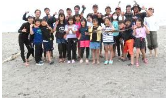
昆布と一緒に記念撮影！