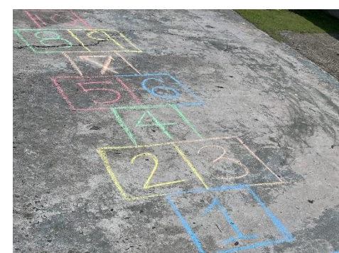
ある日のある学校の体育の時間。日本では「ケンケンパ」と言って遊ぶよと伝えと、パラオでも「ケンケン」と言うとのことでした。