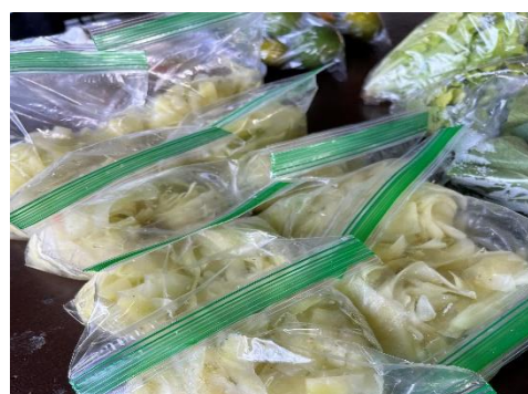
週 1 回、木曜日の朝にやっているマーケットで見つけました。これは何?と聞くと、「パパイアのツケモノ」とのこと。次回トライします！