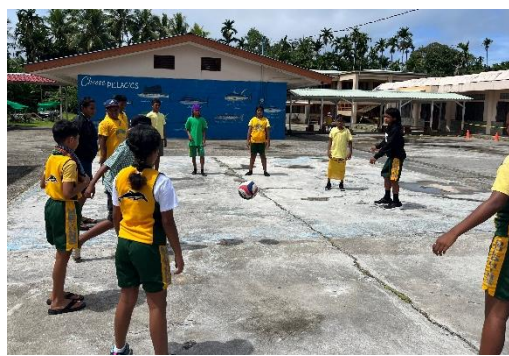
ある日のある学校の休み時間。みんなで丸くなくてバレーをしていました。子どもたちから「オシイ!」「ゴメン!」と聞こえてきました。