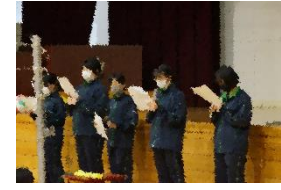
タブレット使用の集会の様子（上段）、球技大会の様子（下段）