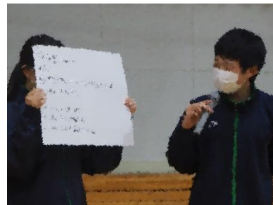
いじめ撲滅集会の様子