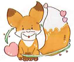
キタキツネのこるる